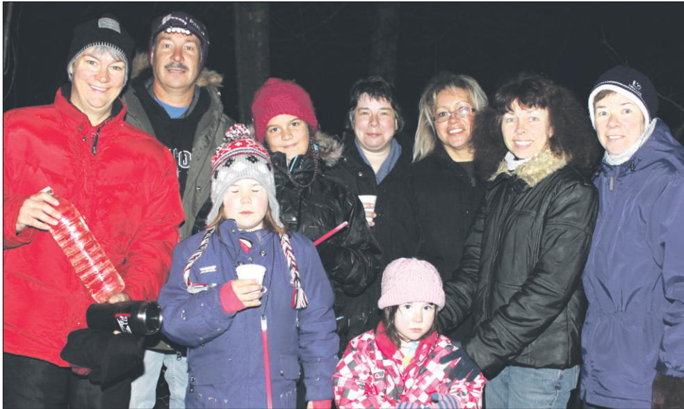
Il n'y avait pas que « les têtes grises » qui participaient à la cueillette de l'eau de Pâques, lors de la troisième édition de la Fête de l'eau de Pâques. On voit ici un groupe de « jeunesses », comme le disaient les Anciens.