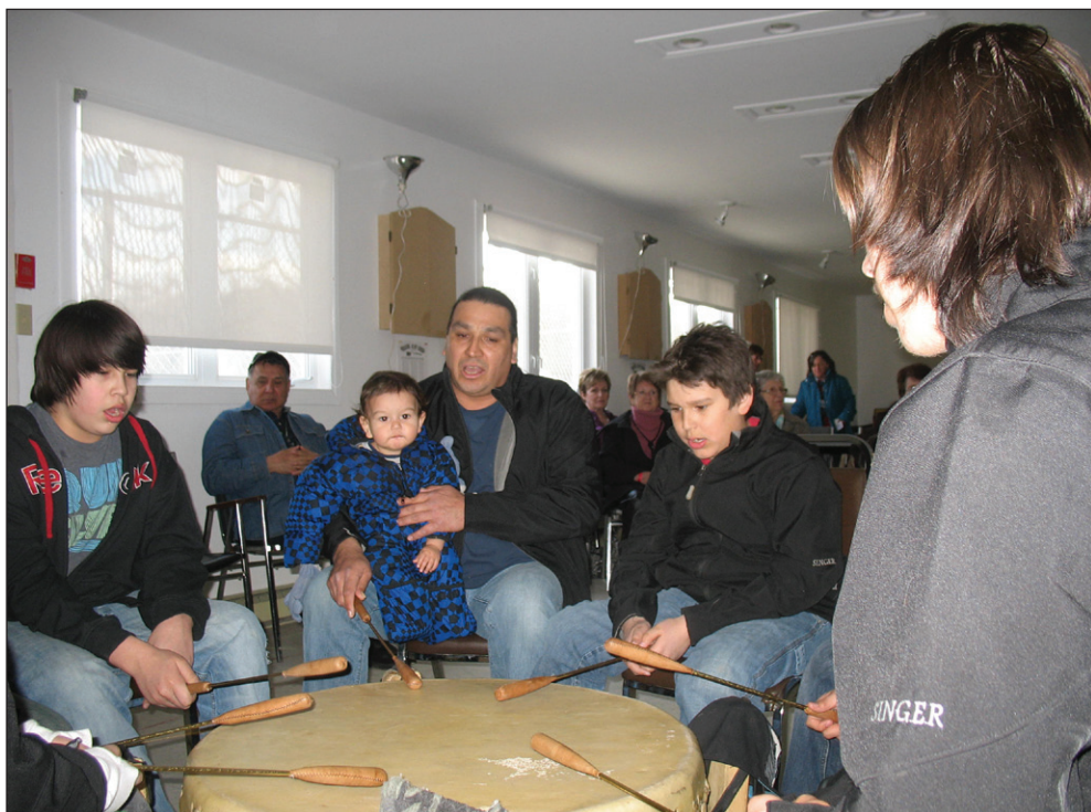
La cérémonie d'ouverture du festival avait lieu vendredi soir au centre communautaire de Lac Sainte-Marie. Elle a été introduite par des drummers et danseurs de la réserve Kitigan Zibi Anishinabeg,