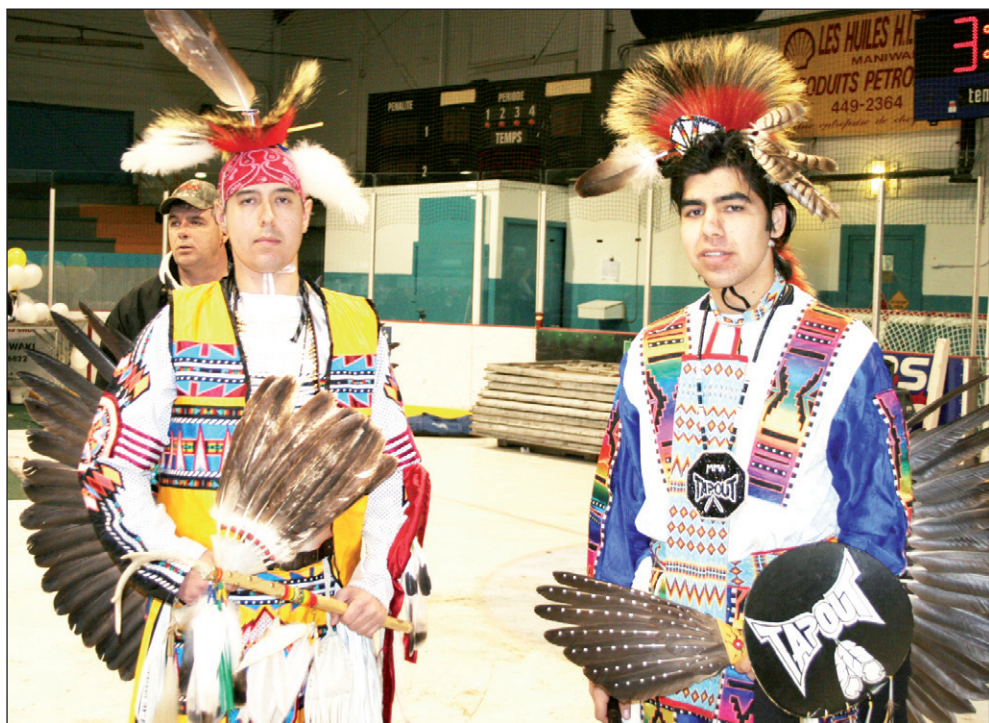
La participation de la communauté Anishinabe a été fort appréciée lors cette Pakwaun 2011.