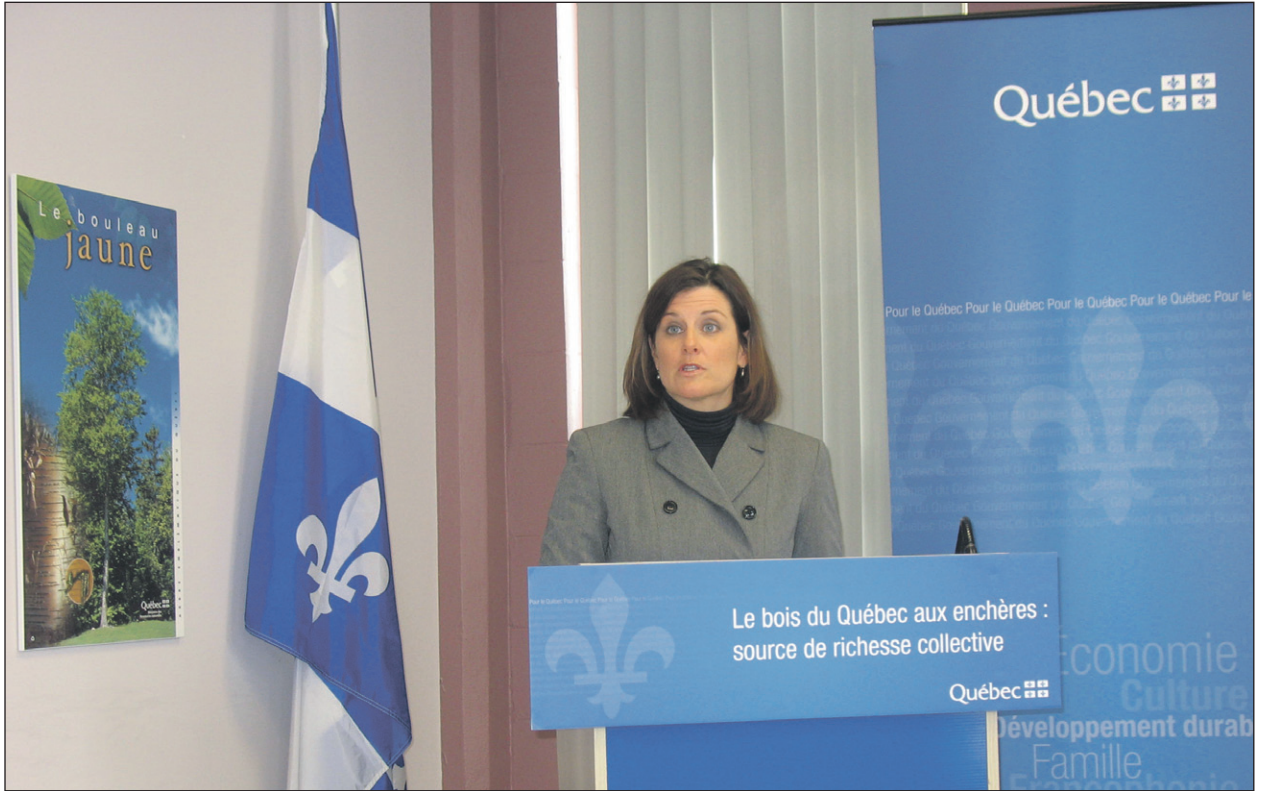
Stéphanie Vallée, la députée de Gatineau.

Le BMMB sera responsable des enchères par lesquelles seront attribués les volumes de bois provenant de la forêt publique et qui sont vendus aux entreprises de transformation. Ce système remplacera celui des Contrats d'aménagement et d'approvisionnement forestiers (CAAF), jugé obsolète, notamment parce qu'il empêchait des entreprises locales de s'approvisionner en bois dans leur propre région car il était accaparé par des grandes entreprises.