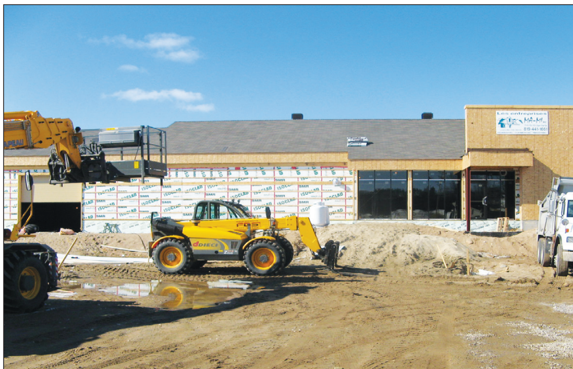
Les Entreprises Ma-Mi inc. poursuivent les travaux de construction du Centre multifonctionnel à Maniwaki.

L'ensemble des municipalités de la MRC de la Vallée-de-la-Gatineau ont été invitées à contribuer