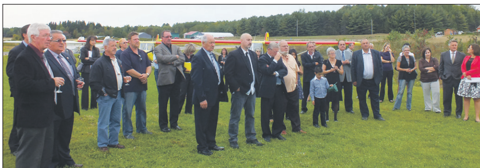
Des maires et personnalités de la région avaient également été invités à l'événement.