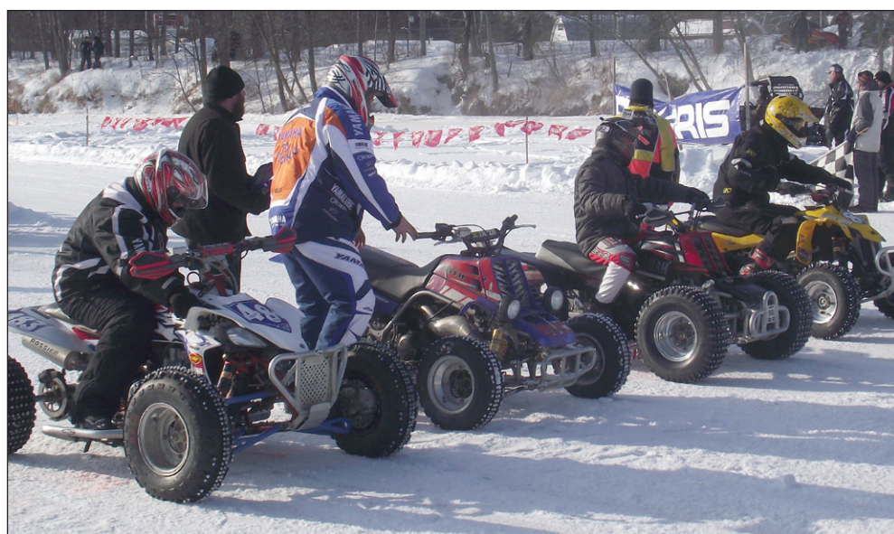
Le compétition de VTT s'est déroulée comme sur des roulettes samedi dernier sur la rivière Désert à Maniwaki.