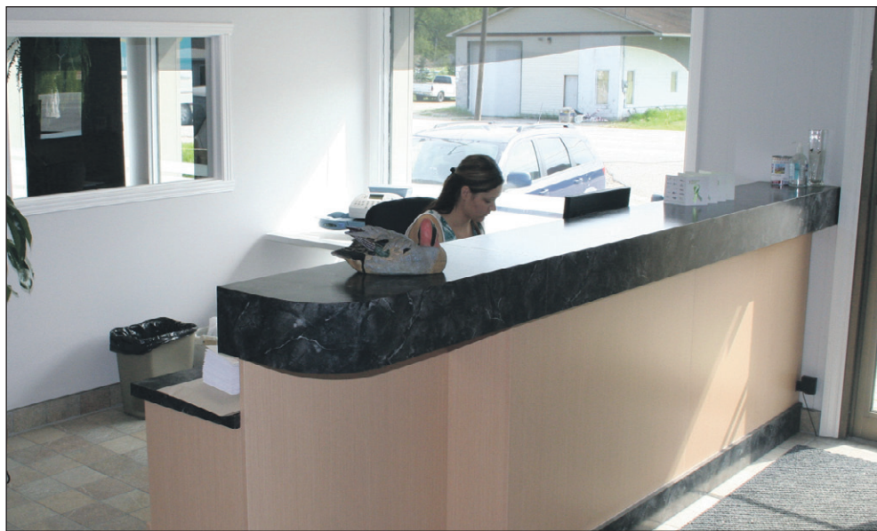
L'espace réservé à la réception est clair et spacieux.

cuisine et une salle de conférence adaptées aux nombreuses rencontres d'équipe, un vaste local pour l'encartage et la livraison du journal avec tous les équipements requis pour alléger le travail des membres de l'équipe, bref, du tout nouveau, tout beau !