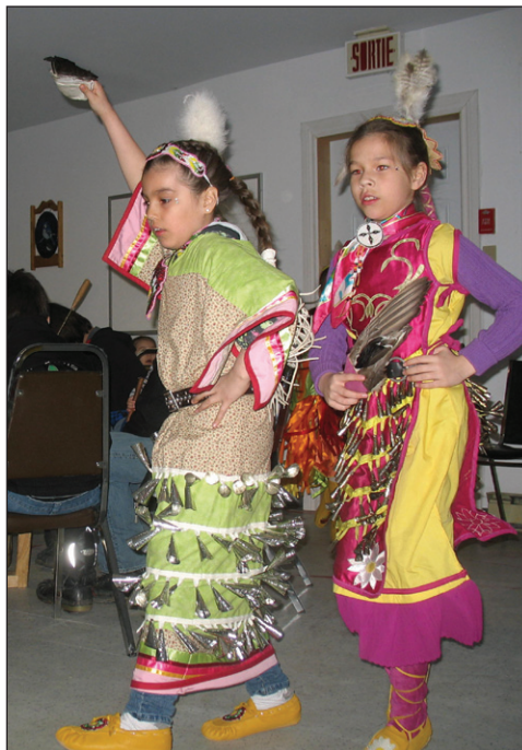
Les danseuses de Kitigan Zibi Anishinabeg.