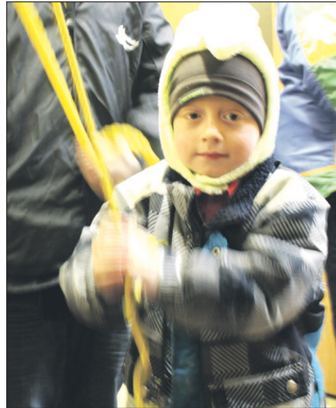
Les cloches ont sonné, durant 15 minutes, pour inviter les gens à participer à la cueillette de l'eau de Pâques. Même des tout-jeunes ont servi de « sonneurs ».

Que cette nouvelle année soit remplie d'heureux moments