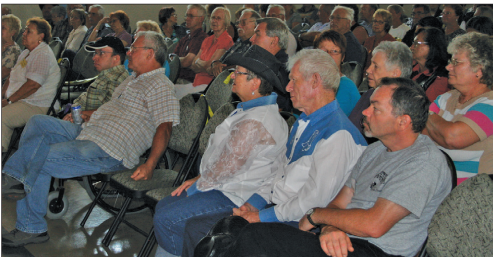
L'achalandage a été constant comme le démontre cette photo.