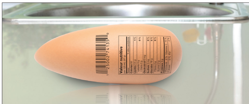
L'oeuf truqué : une oeuvre d'art de notre infographe Stéphane Bogé.

Même si les cas de contamination ont été inexistant dans notre région, le ministère estime que plus la bactérie e.coli se répand, plus elle acquiert une résistance aux antibiotiques, avec les conséquences que l'on connaît. «Il