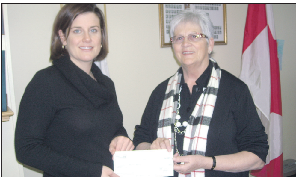
La participation financière a été généreuse à bien des niveaux, ce qui a certainement aidé beaucoup à présenter une Pakwaun haute en couleurs,