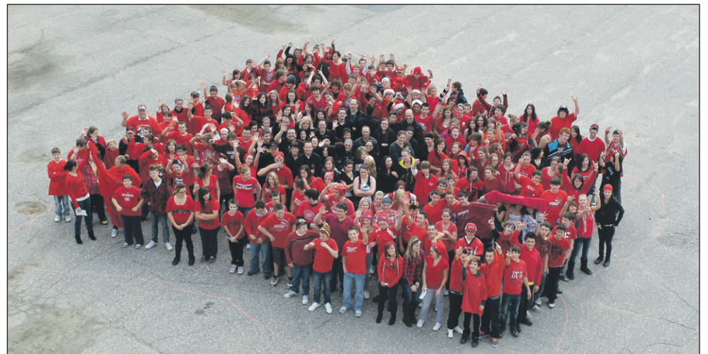
Sur le stationnement arrière de l'école, les élèves et les enseignants se sont rassemblés pour former un coquelicot. Les élèves, habillés en rouge, constituent les pétales, alors que les enseignants, en noir, sont au centre.