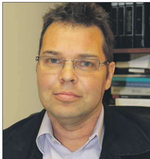
Le psychiatre Richard Payeur est de ceux qui croient au retour aux études de personnes atteintes d'une maladie mentale.

individuellement. La bourse comprend les frais de scolarité et le matériel scolaire. Une personne qui étudie à temps partiel a également droit à une bourse. Il peut s'agir d'études secondaires, d'un diplôme d'études professionnelles, collégiales ou universitaires ou des cours privés dans des domaines aussi variés que la cuisine, la menuiserie, la massothérapie. Pour poser sa candidature, il faut compléter le formulaire de demande de bourse disponible à la Fondation Pierre-Janet. Pour plus de détails : 819-776-8036.