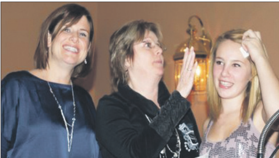
La députée Stéphanie Vallée a gagné un voyage de pêche et l'a remis en jeu. Il a été remporté par Louise Carpentier.

Des cérémonies protocolaires ont marqué cette activité qui sera sûrement inscrite dans les annales de l'école comme étant un geste humain peu commun. La solidarité des élèves était manifeste. Les élèves étaient habillés de rouge pour constituer les pétales du coquelicot alors que les enseignants se sont dressés au centre, vêtus de noir. Ce fut un instant magique qui a été appuyé inconditionnellement par la direction de l'école qui n'a pas manqué d'encourager les élèves et les protagonistes de cette activité tout au long de sa préparation de même que le jour même de sa présentation. Une belle scène qui va sûrement s'inscrire dans la mémoire des participants pour des années à venir.