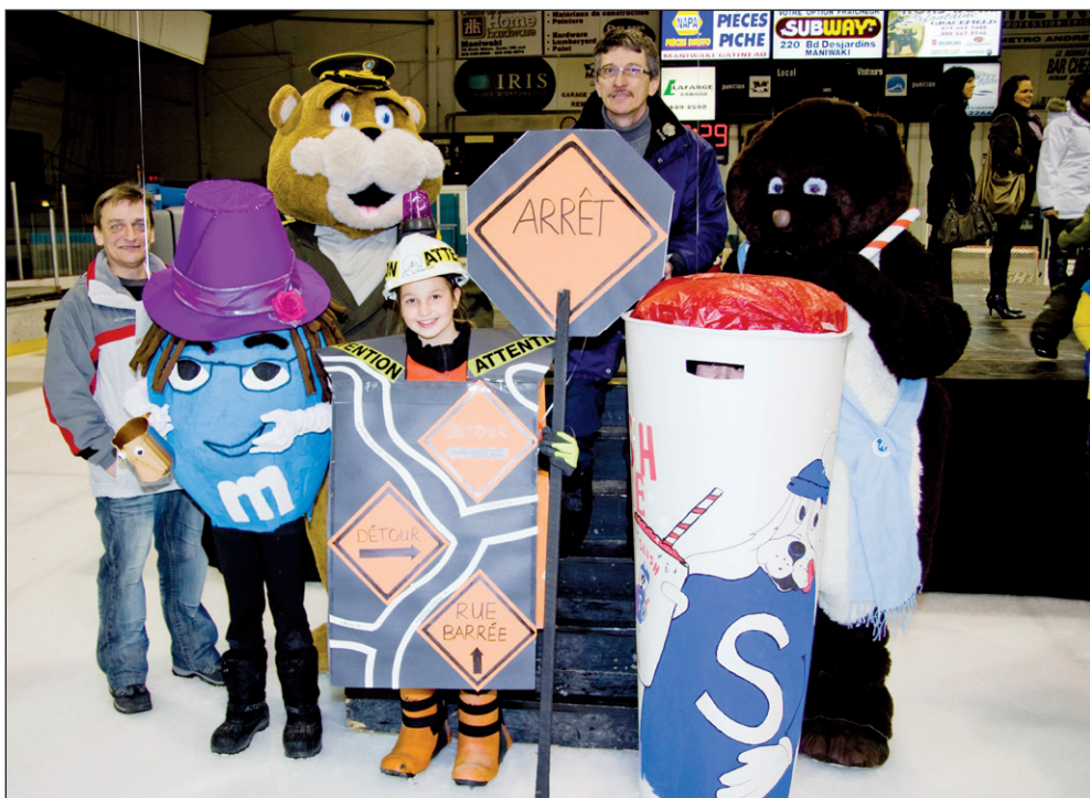
Les jeunes ont répondu en grand nombre à l'invitation du club Richelieu de Maniwaki en participant à la mascarade jeudi soir dernier au Centre des loisirs de Maniwaki.

pour l'édition 2012. Les artistes locaux ont volé la vedette tout au long de l'édition 2011 tant à l'aréna de Maniwaki pour le bal à l'huile du samedi soir que dans les bars et les salles communautaires de la ville.