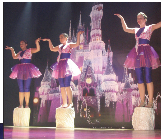
Les élèves du cours de jazz.