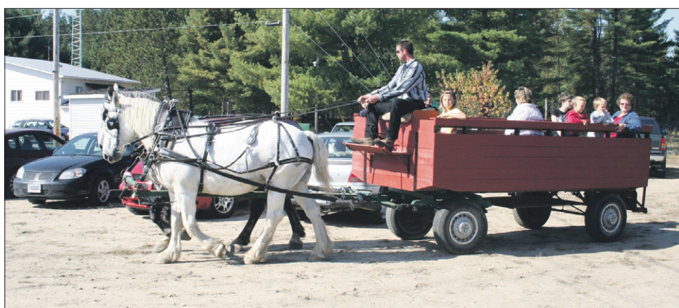
Une bonne promenade en un samedi radieux. Rien de mieux !

Plusieurs activités, axées sur la famille, ont eu lieu tout au long du festival auquel ont participé plusieurs organismes du milieu.